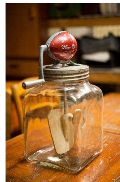
Foto 1 en 2: Pieter Baert © CEAH Foto 3: Didactisch toestel: een boterkarn, foto Pieter Baert © CEAH

geschiedenisonderwijs en erfgoededucatie op verschillende wijzen ingebouwd worden. De Duitse historicus Bodo von Borries onderscheidt drie invalshoeken van waaruit bronnen en erfgoed kunnen bekeken worden: dat van de historische actoren, dat van het discours en dat van de actuele meningen van leerlingen. 6 Het ontwikkelingsgericht erfgoedproject Meerstemmig Erfgoed o.l.v. Paul Janssenswillen e.a. (2016-2018) werkte een gefaseerde matrix uit om deze open benadering toe te passen in erfgoed-educatie. 7