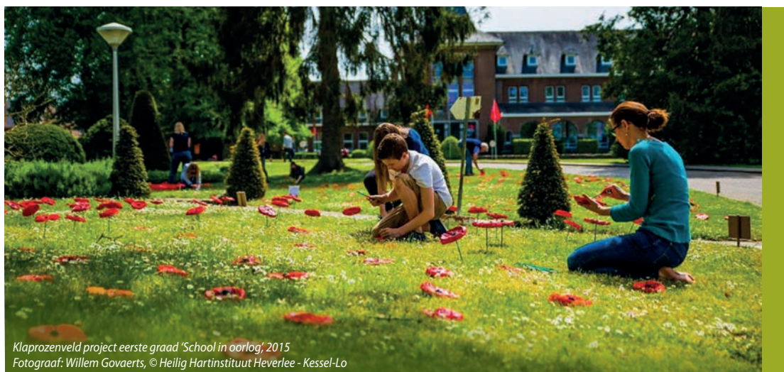
Klaprozeenveld project eerste graad 'School in oorlog', 2015

Erflaters van het vrij onderwijs doen tot vandaag grote inspanningen om hun erfgoed te vrijwaren voor de toekomst. In situ werkingen als het Erfgoedhuis van de Zusters van Liefde (Gent) of vzw Cultureel erfgoed annuntiaten (Heverlee) hebben, financieel gedragen vanuit het religieuze instituut en bij de opstartfase professioneel ondersteund vanuit KADOC-KU Leuven, een voorbeeldfunctie. Nu hebben de instellingen maturiteit en zelfstandigheid bereikt. De werkingen zijn erkend, projectmatig gesteund en opgenomen in een nauw samenwerkingsverband in het erfgoedlandschap. Hopelijk komt er in de toekomst vanuit de organisatie zelf voldoende zuurstof om de essentie van hun werking te verankeren. Scholengemeenschappen als KOGKA Geel-Kasterlee ruimen er alvast plaats in hun kader voor in.