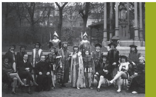
Toneelspelers en regisseurs van het Collège Saint-Servais in Luik, ca 1900

Praktijkvoorbeelden tonen aan dat het ook anders kan. Neem de onthaalruimtes in het Heilig Hartinstituut in Heverlee die de voorbije vakantie opgefrist werden. Verbazing alom toen de technische ploeg achter het behangpapier opvallend intacte neogotische muurschilderingen tevoorschijn toverde. Jarenlang was dit 'démodé restant' uit het verleden aan het gezicht onttrokken, maar nu werd het gevoel gedeeld dat deze trouwaille niet mocht worden gecamoufleerd. Er werd overlegd tussen de directie, de gebruiker van het lokaal, de technische dienst en erfgoeddeskundigen. De conclusie was om een volledige strook vrij te laten, te reinigen en te omlijsten. Het venster op het verleden geeft een unieke en authentieke look aan dit strak ingerichte schoolkantoor.